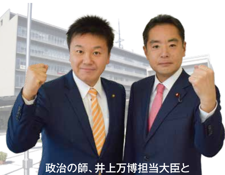
政治の師、井上万博担当大臣と